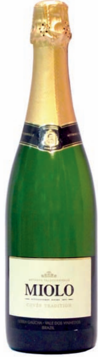
Artikel 912 Miolo Cuvée Tradition

Brasilianischer trockener Sekt, Vale dos Vinhedos, aus Pinot Noir und Chardonnay. Limitierte Auflage! 13,0% vol. 750ml