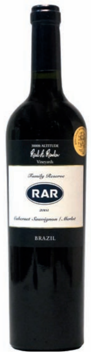
Artikel 928 Miolo RAR

Ein Miolo-Stammhausprodukt, entwickelt aus speziell angebauten Rebsorten. Limitierte Auflage! Jahrgang 2004. 13,0% vol. 750ml