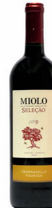
Artikel 942 Miolo Seleção, Tempranillo/Touriga

Feine Selektion aus den Rebsorten Chardonnay und Viognier, vereinigt in einem ausgewogenem und harmonischem Cuvée. 11,5 % vol. 750ml