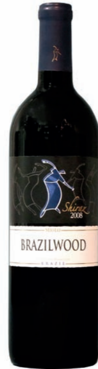
Artikel 906 Miolo Brazilwood Shiraz

Brasilianischer Weißwein aus dem sonnigen Sertão, trocken, mit leichten Strukturen und Blütenaroma. 11,0% vol. 750ml