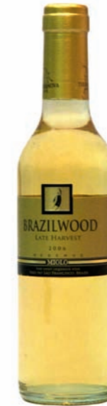
Artikel 903 Miolo Brazilwood Late Harvest

Brasilianischer Rotwein aus dem sonnigen Sertão, kräftiger, trockener Wein. 14,0% vol. 750ml