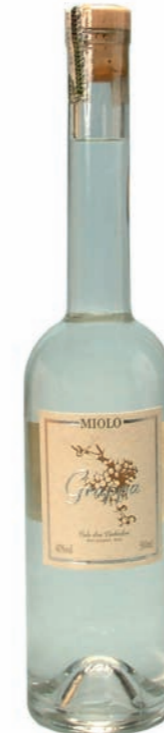
Artikel 930 Miolo Trester Grappa

Hergestellt aus der Destillation fermentierter Trauben Cabernet Sauvignon. Delikates Aroma. 40,0% vol. 500ml