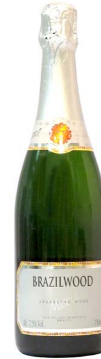
Artikel 910 Miolo Brazilwood Moscato

Brasilianischer Weißwein aus dem sonnigen Sertão, Spätlese aus der Muskat-Traube. 14%vol. 375ml