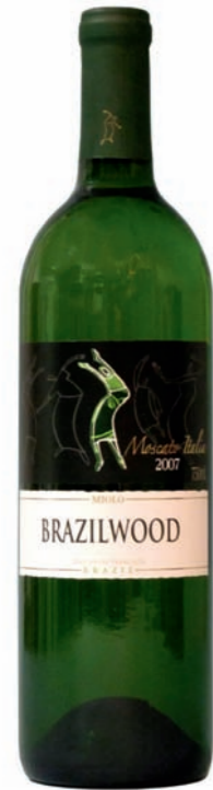
Artikel 902 Miolo Brazilwood Muskat

Brasilianischer Weißwein aus dem sonnigen Sertão, trocken, mit leichten Strukturen und Blütenaroma. 11,0% vol. 750ml