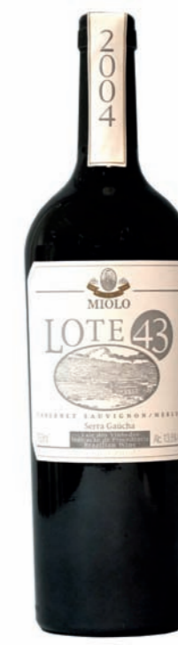
Artikel 919 Miolo, Merlot Cabernet Sauvignon, Lote43

Ein junger, frischer Barrique- Weißwein mit einer grünlich goldenen Farbe. Intensives Aroma und harmonischer Abgang. 13,0% vol. 750ml