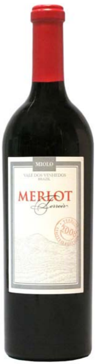
Artikel 933 Miolo Merlot Terroir

Castas Portuguesas, feiner trockener Rotwein aus der Campanha, RS. Portugies. Rebsorten Touriga nacional, Alfrocheira, Tinta Roriz. 13,5% vol. 750ml