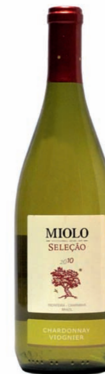
Artikel 941 Miolo Seleção, Chardonnay/Viognier

Feine Selektion aus den Rebsorten Cabernet Sauvignon und Merlot, vereinigt in einem ausgewogenem und harmonischem Cuvée. 12,5 % vol. 750ml