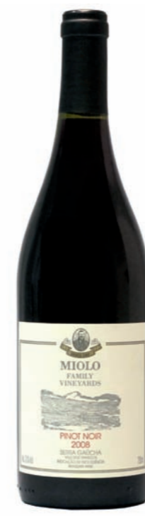
Artikel 917 Miolo Family Vineyards, Pinot Noir

Barrique-Rotwein mit vollem Körper und samtigen Abgang. Er vereint Eiche mit einem komplexen Bouquet. 13,0% vol. 750ml