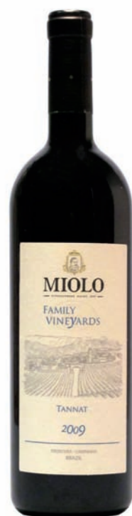
Artikel 935 Miolo Family Vineyards, Tannat

Qualitätswein aus der Rebsorte Tannat, sorgfältig ausgelesen im Weingut der Familie Miolo im Seival des Campanha Weingebiets. 13,5 % vol. 750ml