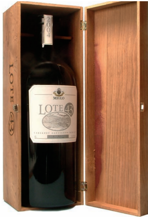
Artikel 929 Cabernet Sauvignon Merlot Lote 43 - METHUSALEM -

Lieferung in einer exklusiven Holzkiste mit Einprägung von Name und Jahrgang! Limitierte Auflage! 13,5 % vol. 6L