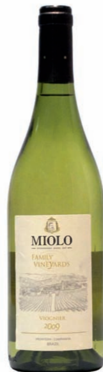
Artikel 938 Miolo Family Vineyards, Viognier

Qualitätswein aus der Rebsorte Sauvignon Blanc, sorgfältig ausgelesen im Weingut der Familie Miolo im Seival des Campanha Weingebiets. 12,5 % vol. 750ml