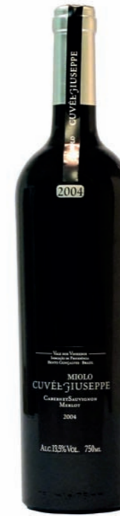
Artikel 931 Miolo Cuvée Giuseppe

Hergestellt aus der Destillation fermentierter Trauben Cabernet Sauvignon. Delikates Aroma. 40,0% vol. 500ml