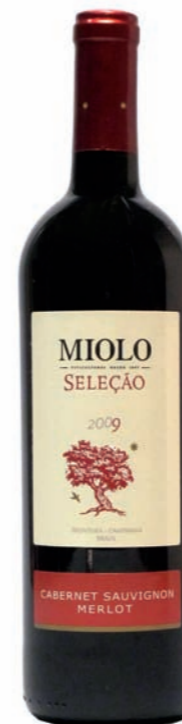
Artikel 940 Miolo Seleção, Cabernet Sauvignon/Merlot

Qualitätswein aus der Rebsorte Viognier, sorgfältig ausgelesen im Weingut der Familie Miolo im Seival, des Campanha Weingebiets. 12,0 % vol. 750ml