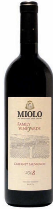
Artikel 915 Miolo Family Vineyards, Cabernet Sauvignon

Brasilianischer Sekt, Vale dos Vinhedos, 50% Pinot Noir, 50% Chardonnay. 11,5% vol. 750ml