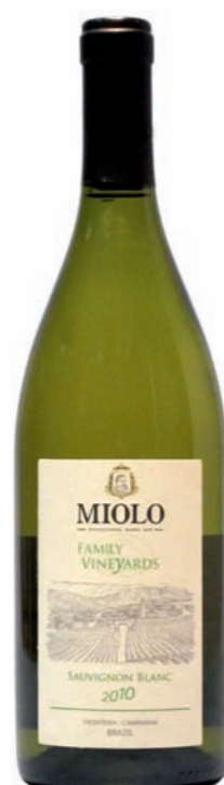
Artikel 937 Miolo Family Vineyards, Sauvignon Blanc

Qualitätswein aus der Rebsorte Tempranillo, sorgfältig ausgelesen im Weingut der Familie Miolo im Seival des Campanha Weingebiets. 13,0 % vol. 750ml