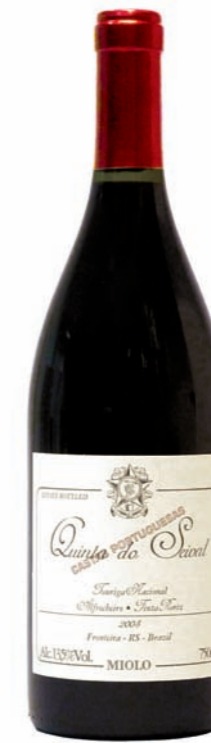
Artikel 932 Miolo Quinta do Serval

Feiner trockener Rotwein, Vale dos Vinhedos. 60% Cabernet Sauvignon und 40% Merlot. 13,5% vol. 750ml