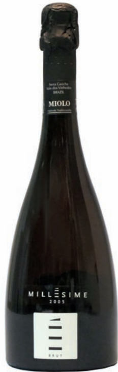
Artikel 911 Miolo Brut MILLESIME

Brasilianischer trockener Sekt, Vale dos Vinhedos, aus Pinot Noir und Chardonnay. Limitierte Auflage! 13,0% vol. 750ml