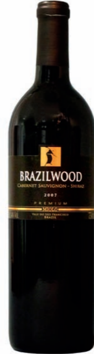
Artikel 907 Miolo Brazilwood Cabernet Sauvignon/Shiraz

Brasilianischer Rotwein aus dem sonnigen Sertão, trockener junger Wein, kräftig. 13,0% vol. 750ml