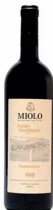
Artikel 936 Miolo Family Vineyards, Tempranillo

Qualitätswein aus der Rebsorte Tannat, sorgfältig ausgelesen im Weingut der Familie Miolo im Seival des Campanha Weingebiets. 13,5 % vol. 750ml