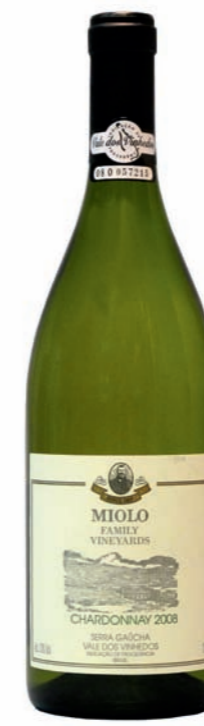
Artikel 918 Miolo Family Vineyards, Chardonnay

Barrique Rotwein. Sehr reife und schwarze Beerenaromen mit konzen- triertem Fruchtbouquet. 13,0% vol. 750ml