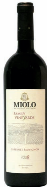
Artikel 916 Miolo Family Vineyards, Merlot

Ein beständiger Barrique- Rotwein, intensive Farbe mit betonten Körper nach Eiche und dunklen Früchten. 13,0% vol. 750ml